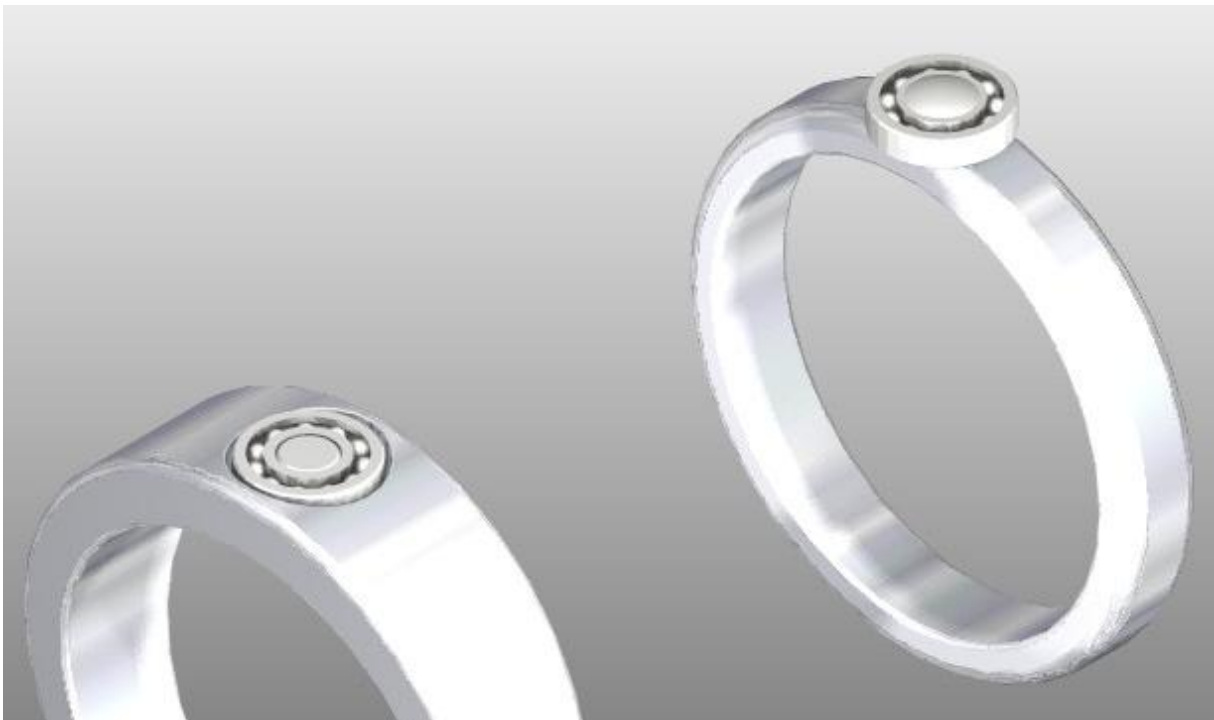
Zwei Beispiele zur Befestigung: auf Dorn aufgespresst (links) oder Stift mit Kappe, der innen im Ring vernietet wird (rechts).